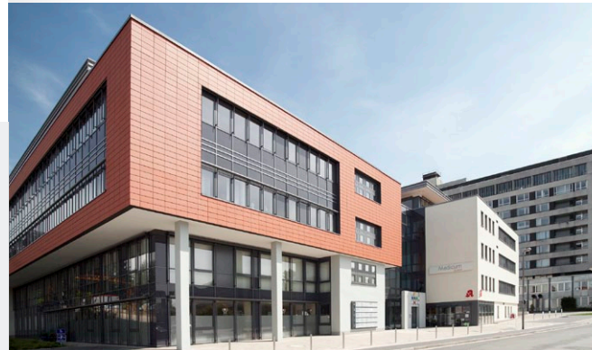
saenger-hemze | 02-2016

Bei regelmäßiger Teilnahme werden die Kosten von den Krankenkassen übernommen.